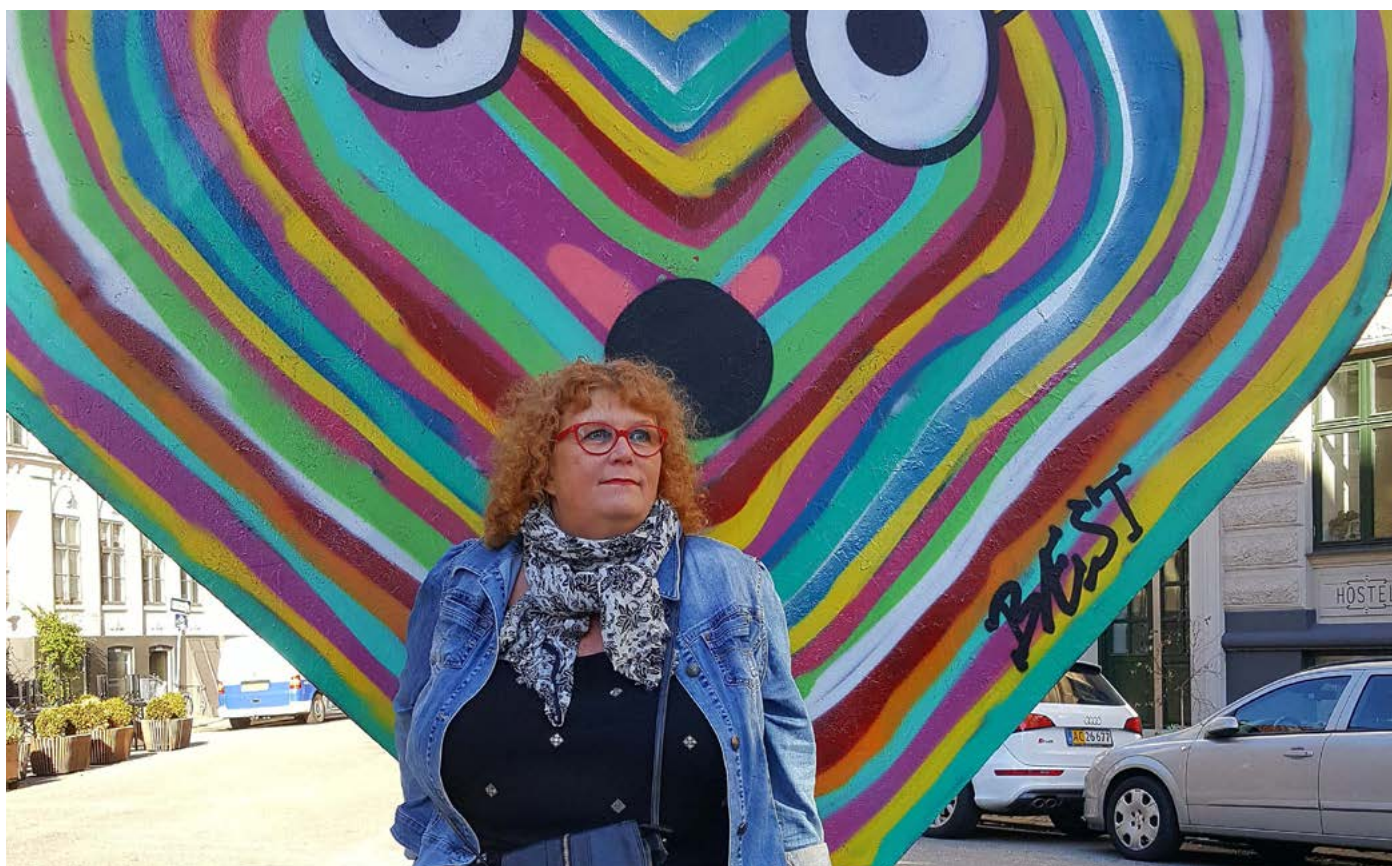
Fra byvandringen Istedgade overgi'r sig aldrig, hvor jeg fortæller en masse historier fra min bog om Istedgades historie.

I sommeren 2001 var vi tre arkæologpiger, som kørte rundt i Nordsjælland. Vi besøgte Gurre-udgravningen, var forbi Esrum Kloster, men da vi var på vej mod Søborg Borg-